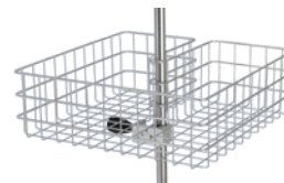
Grand panier pour ustensiles stériles, 460 × 460 × 150 mm. Réf. Z2N65842