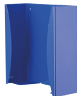
Support pour boîtes à gants latex. 280 × 270 × 100 mm. Réf. Z2N658PB. Format double, 390 × 260 × 100 mm. Réf. Z2N655PB