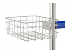
Panier pour ustensiles stériles, 300 × 200 × 100 mm. Réf. Z2N659PB