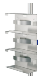
Support pour boîtes, 240 × 403 × 99 mm. Réf. Z2N670PB