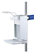
Distributeur à désinfectant 500ml avec bac en mélamine. Réf. Z2N660PB