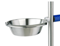
Bol 2 litres, 300 × 200 × 100 mm. Réf. Z2N061PB