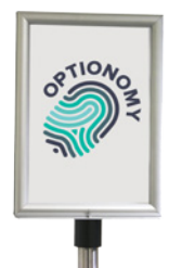
Tableau d'affichage, env. 235 × 320 mm. Réf. Z2N11111