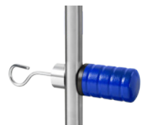
Crochet. Réf. Z2N668PB