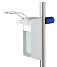
Distributeur à désinfectant 500ml. Réf. Z2N657PB